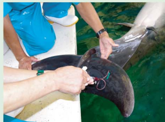
受診動作による採血。採取された血液は動物の様々な情報を知る手掛かりになります。