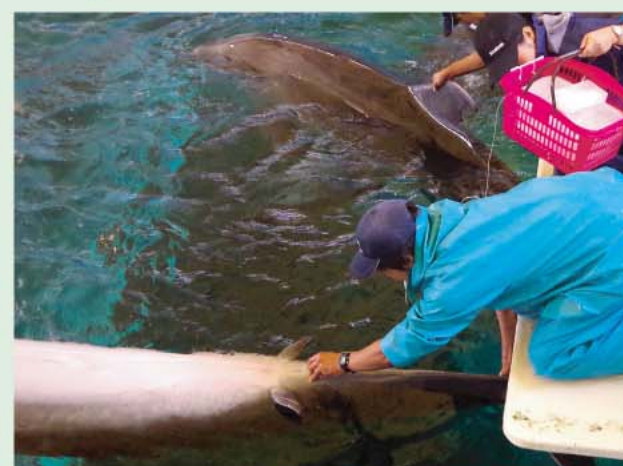
体温測定。毎日の体温測定は健康状態を知るために欠かせません。

※プロゲステロンは女性ホルモンの1種で、排卵後に形成される黄体から分泌されるホルモンです。プロゲステロン濃度を測ることで、排卵や妊娠を知ることができます。