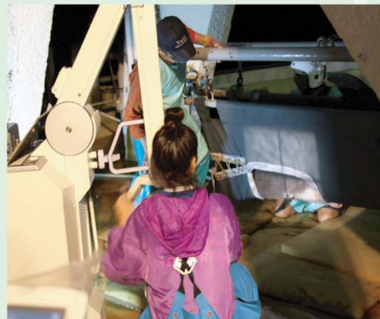
2011年11月に行われた腹びれのレントゲン撮影。沖縄美ら海水族館ほか全国から多数のプロジェクトメンバーが参加し、慎重に作業が行われました。