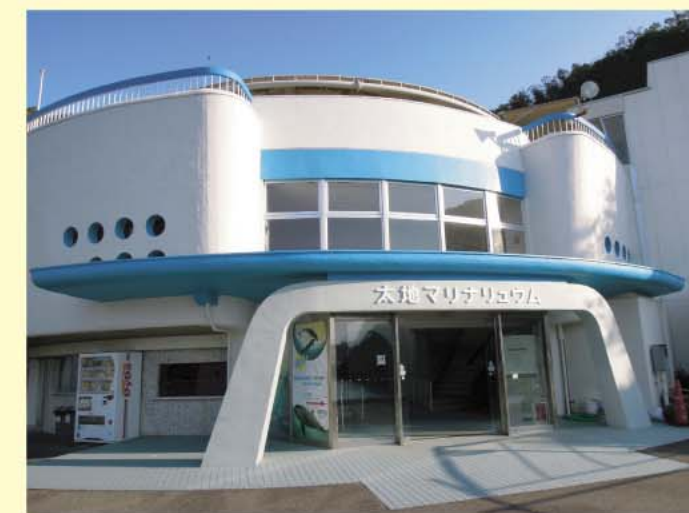
海洋水族館マリナリウム

大水槽は16.3m×12.0mのだ円形で、深さ5.0m、水量は620t。トンネル状観察部と側面観察窓を有し、「はるか」の腹びれや行動を間近に観察することができました。